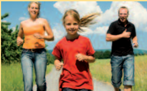
Laufen gegen betrübt Stimmung

Zahlreiche Untersuchungen zeigen eine positive Wirkung von Sport gegen Depressionen – etwa eine 2008 erschienene Analyse von 25 Studien („Cochrane Review“). Als am besten geeignet hat sich moderater Ausdauersport erwiesen, der regelmäßig ausgeübt wird. Für nachhaltige Motivation könnte die Zusammenarbeit mit einem geschulten Trainer sorgen. Mehrere Studien diagnostizieren Bewegung eine höhere Wirksamkeit als Antidepressiva. Natürlich sollte vor Beginn der sportlichen Tätigkeit ein Arzt kontaktiert werden.