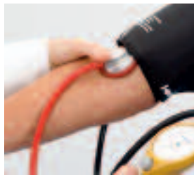
Spitzenmedizin & Menschlichkeit gehen in Wien Hand in Hand.

Die Stadt lässt niemanden alleine: Eltern, Kinder und Jugendliche bekommen Unterstützung vom Amt für Jugend und Familie. Wer ein geringes Einkommen hat, erhält Wohn- oder Mietbeihilfe. Um sozial schwachen Menschen unter die Arme greifen zu können, hat die Stadt das Sozialbudget um 20 % erhöht. Konkret heißt das z. B. 3,4 % mehr Sozialhilfe und bis zu 6 % mehr Landespflegegeld. Auch im hohen Alter gibt es für alle ein