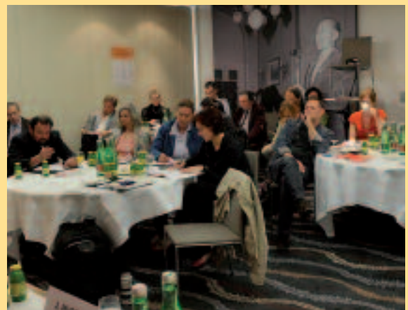
Journalisten lauschten den Ärzten