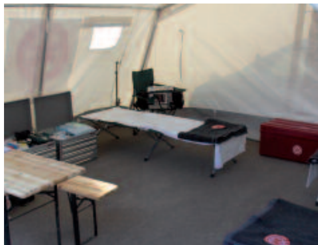
Was für den Katastrophenschutz nötig und möglich ist, zeigen Organisationen wie der SMD